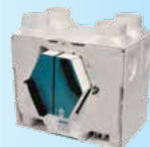
Permutador duplo fluxo